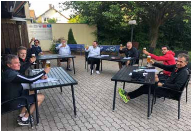
Social Distancing drinnen

Umso mehr wurde auf der eigenen Anlage fleißig trainiert. Das traditionelle Bierchen und Essen danach sah dann so aus: Social Distancing draußen: